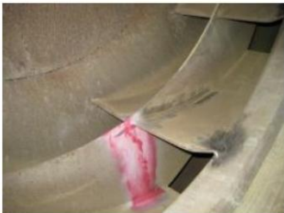
Sprickbildning i rökgasfläkt

PROSWECO utför som oberoende part skadeanalyser både i fält och via analys av skadade komponenter.