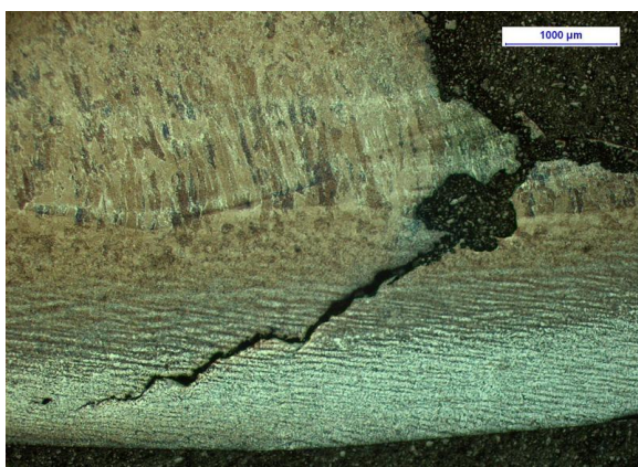
Metallografisk undersökning av båtprov