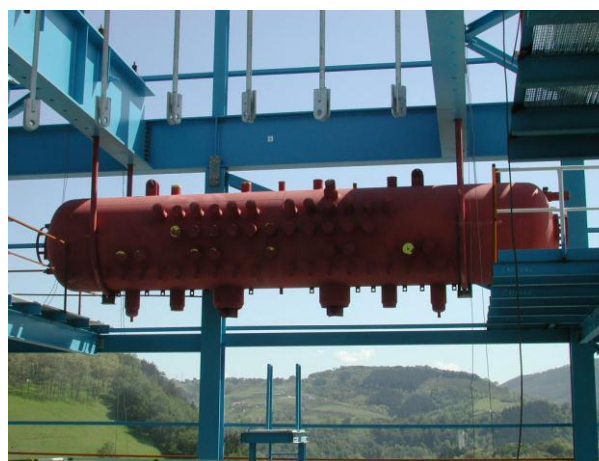
Ångdom under montage

PROSWECO har, förutom flertalet andra uppdrag, utfört oberoende tredjeparts QA/QC av huvudkomponenter såsom sodapannor och kontinuerliga massakokare i flertalet av de stora nya massabruken som under de senaste åren byggts i Brasilien.